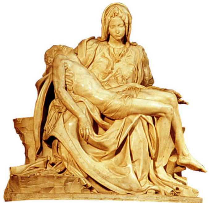
Fig.2 Puntuación máxima. 2 puntos