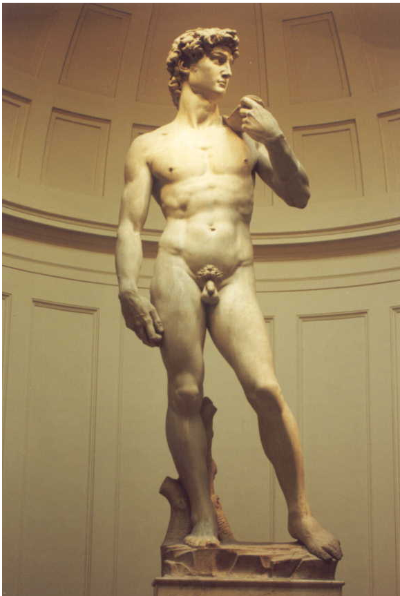
Fig.1 Puntuación máxima. 2 puntos

Analiza y comenta las dos obras de arte presentadas.