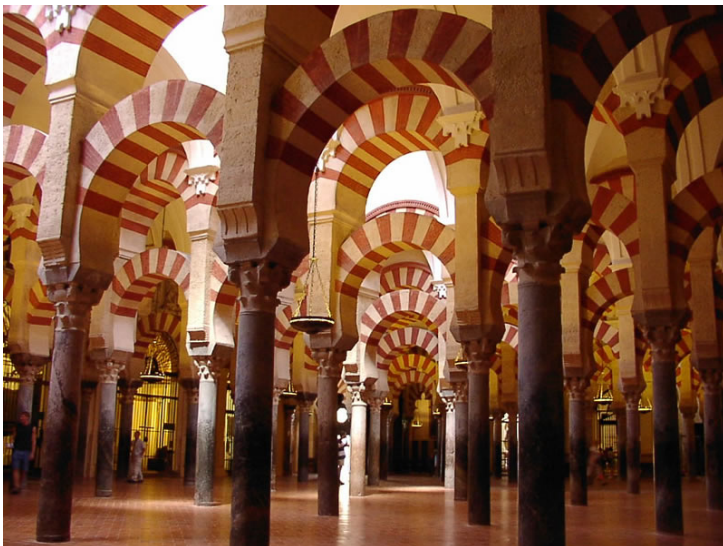
Fig.1 Puntuación máxima. 2 puntos

Analiza y comenta las dos obras de arte presentadas.